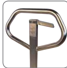
El timón ergonómico asegura al usuario un manejo cómodo.

Las transpaletas están clasificadas como equipos grupo II y son adecuadas para su uso en áreas catalogadas como zona 1. Esto significa áreas en las cuales se genera ocasionalmente una atmósfera explosiva debido a distintos gases.