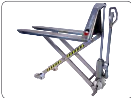
Las transpaletas están fabricadas en acero inoxidable.

La construcción antideflagrante se caracteriza por la siguiente marca de producto: