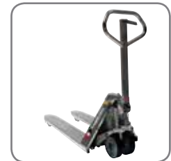
Construcción robusta que asegura una larga vida operativa y un bajo coste de mantenimiento.