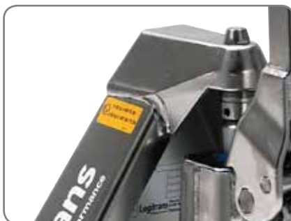
Las transpaletas a antideflagrantes son adecuadas para la industria farmacéutica, e industrias de gas, petróleo y pinturas.

II 2G Ex h IIB T6 Gb II 2D EX h IIB T85°C Db