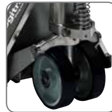
Las transpaletas tienen dos ruedas antiestáticas de vulkollan para derivar la electricidad estática del equipo.